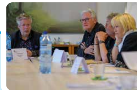
28.06.: Conférence de presse à Strassen