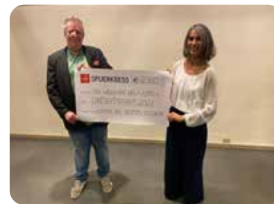
23.03.: Remise d'un don de la part de la Commune de Steinfort au profit de MWMW