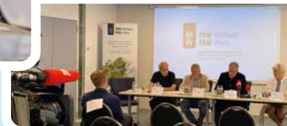
25.03.: Assemblée Générale de MWMW