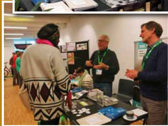
Onze vrijwilligers aan het werk op de RWS-stand